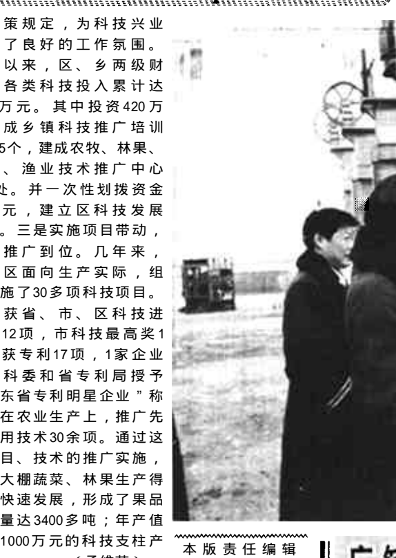
广饶地税稽查工作抓得紧效果好

广饶县土管局积极帮助油田改打单井为丛式井，共节约耕地1456亩，并为油田节省了大量资金。一个井台多口井，三年来，只审批油田建设用地265亩。 （李军章）